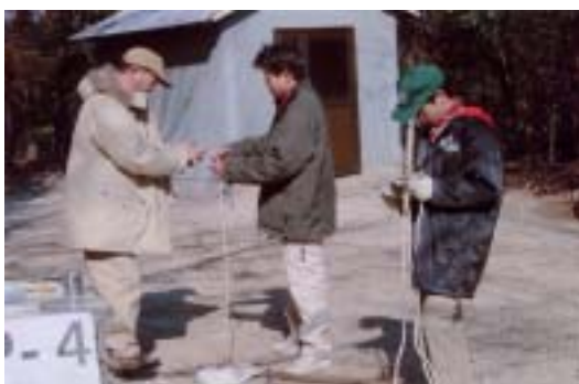
BSハイキング ロープワークゲーム