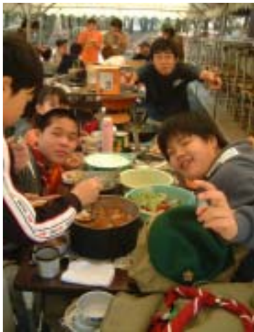
合同デーキャンプ