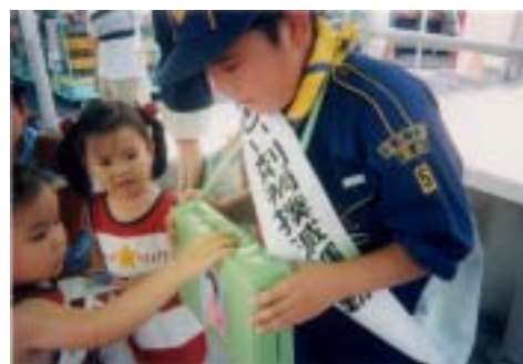
地区 薬物乱用防止啓蒙活動