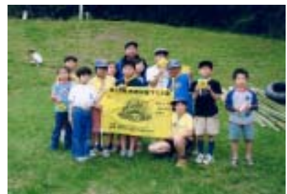
C S隊 月の輪5

目的 豊田市の中心を流れる川 矢作川で筏下りを通じて郷土の自然に触れその素晴らしさと大切さを知るとともに参加者相互の連帯感と豊かな人間性を育み多くの市民へ川への親しみ愛着を広める。 日時 5月11日(日) 9時～13時 場所 集合、スタート 豊田市扶桑町内古岸水辺公園(平戸橋下流左岸) ゴール 豊田氏御立町内御立公園(久澄橋下流左岸)