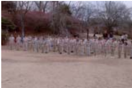
BSハイキング開会式

進歩課程が改訂されたBS部門ですが、ボーイスカウトの活動の中でハイキングが不可欠である事は言うまでもありません。ハイキングを行う為の技能を磨き、より楽しい活動が出来る事を目的とし新しい進歩課程に繋げる事を目標とします。従って、「読図とコンパス」作業を前提としたハイキングを企画し、数箇所でのポイントにてゲーム形式でスカウトスキルを競い合う事をテーマとしました。