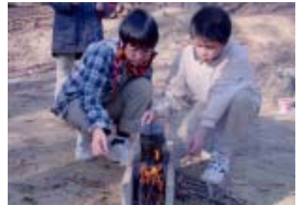
BSハイキング 火おこしゲーム