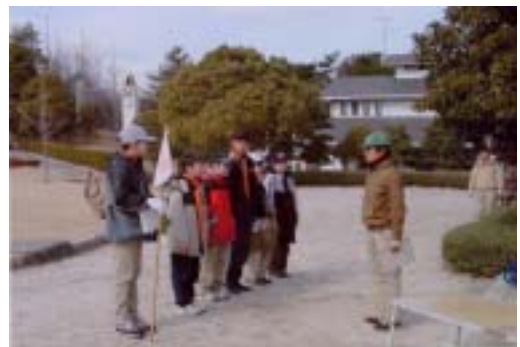
BSハイキング 計測ゲーム

僕たちが歩いたのはAコースで出発地農業試験場から岩作御岳山、富士浅間神社、古戦場、野営場を回って農業試験場へもどってきました。本当は野営場の後もう一つポイントを回る予定でしたが時間がなく行けませんでした。ゲームはネイチャーゲーム、ロープ結び、計測、火おこしがあり、それぞれ面白く、楽しいものでした。火おこしのゲームではトップの成績を取ることができうれしかった。また古戦場で食べた弁当や野営場の暖かいとん汁もおいしかったです。最後のポイントに行けなくて残念でしたが一番早く帰着したことによって賞がもらえ、うれしかった。とっても良い経験となり、楽しい一日でした。