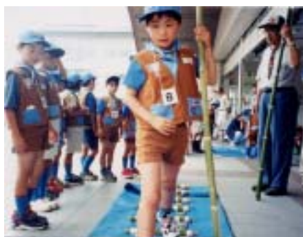
地区 ビーバーラリー

スカウト達一人ひとりがステップアップし、スカウト仲間と一層楽しく活動できるように。