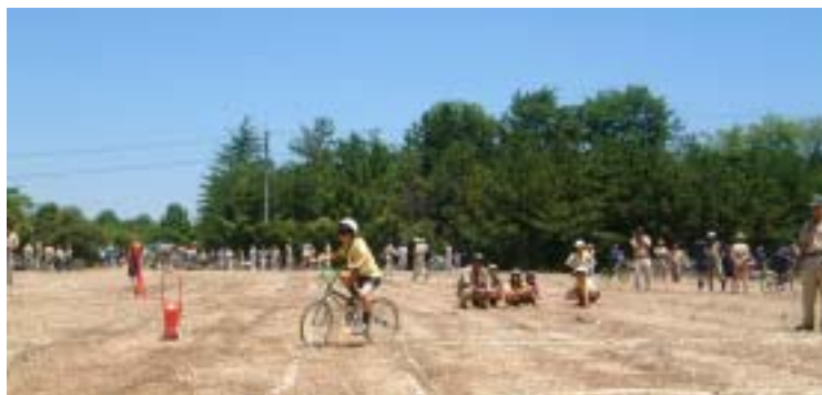
地区 カブ自転車ロデオ大会