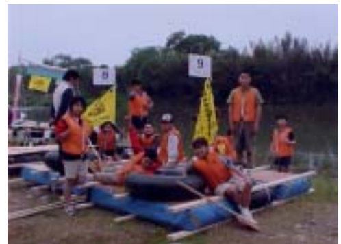
B S隊スチロール1号～2号チーム